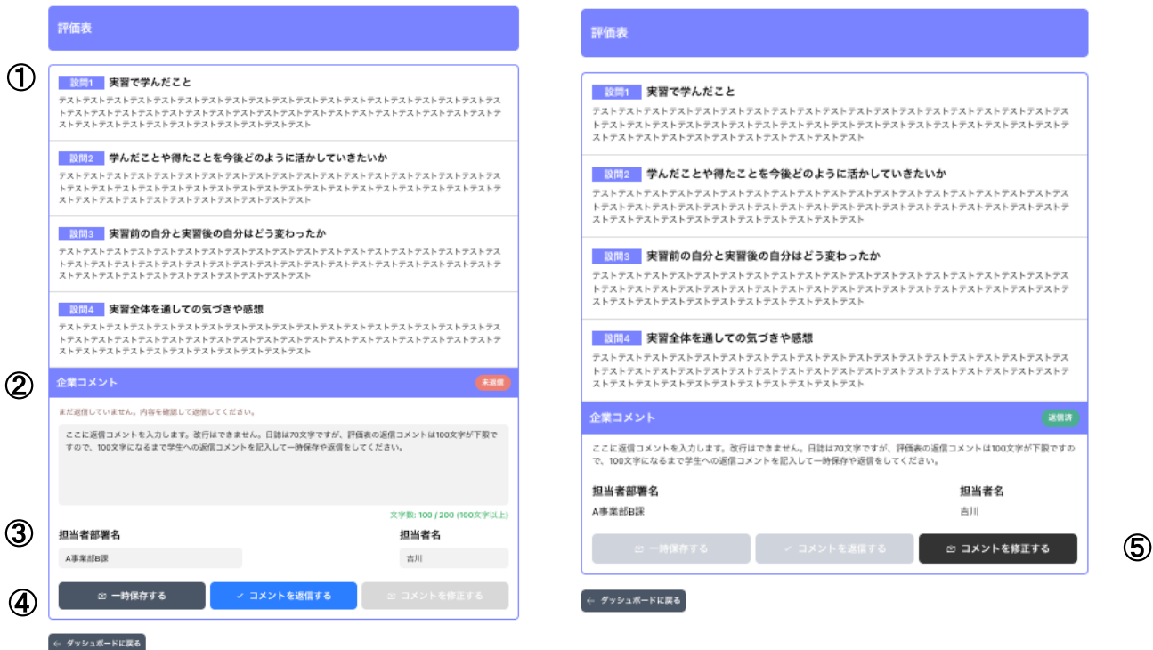
▲ 評価表コメントを入力中の状態

学生は、実習最終日に実習日誌とあわせて、評価表を提出します。詳細ページ下部の「評価表」セクションでは、学生の自己評価（設問1~4）と、企業コメント入力欄が表示されます。手順は日誌コメントと同様です。