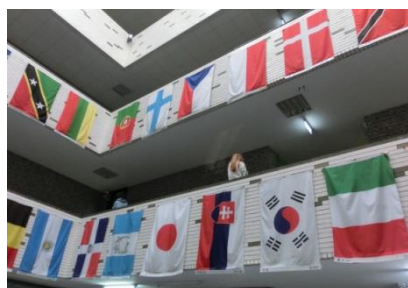
輔仁大學 国際交流センター見学