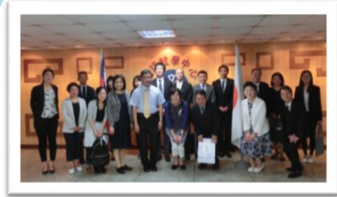
国立台湾師範大学にて

大学コンソーシアム大阪では、2017年10月にSD研修の一環として、台湾・台北において初めての海外研修を行いました。今回の研修では、2008年より交流協定を締結している台湾の全ての大学が加盟する〈財団法人高等教育国際合作基金會〉とも協議しながら、「台北大阪高等教育会議」への参加や同会議での日台両国の職員によるワークショップなどを実施しました。研修参加者が持ち帰った成果を多くの大学関係者と共有し、大学の国際化に向けての参考としていただくため、報告会を開催します。